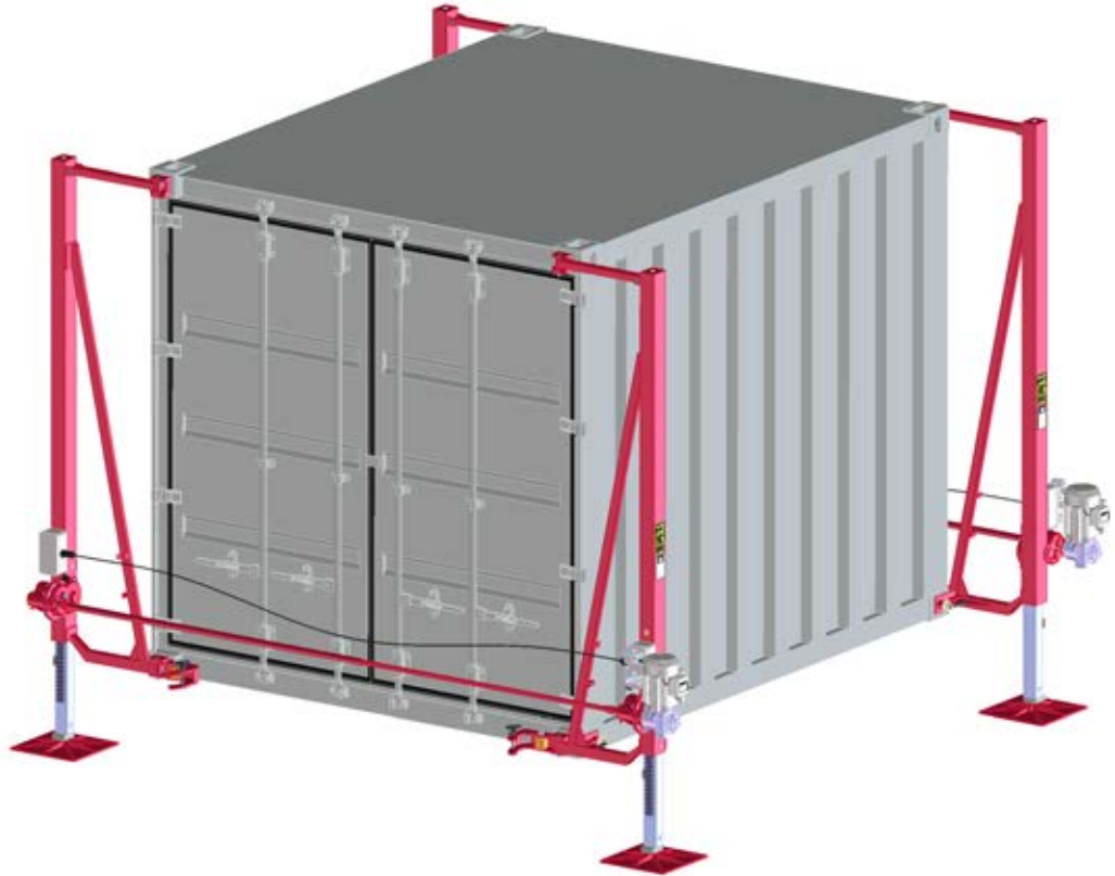
Abb. zeigt stirnseits beischwenkbare Ausführung mit elektrischem Antrieb 230 V-AC / fig. shows version swiveling along short side with motor drive 230 V AC / fig. version pivotante frontale, motorisation 230 V AC

Dispositif de levage 10 t pivotant, type 1889.10